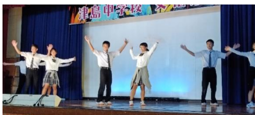
会場を盛り上げたお好み演芸広場での有志のダンス

その後も3年生の職場体験学習発表、長島愛生園訪問の報告、泉風太鼓演奏、吹奏楽部の演奏、そして、有志の生徒がステージで特技を発表するお好み演芸広場と、生徒の活躍がたくさん見られました。美術作品などの展示も多くの方に見ていただけました。