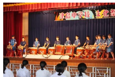
迫力ある泉風太鼓の演奏